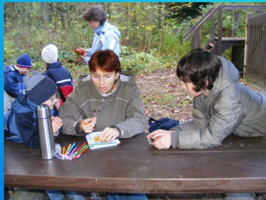
Chudenice – Klatovy říjen 2009