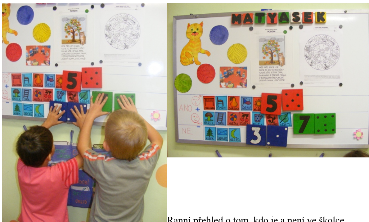
Ranní přehled o tom, kdo je a není ve školce

Jako učitelka MŠ pracuji již dlouhou řadu let, a tak mohu mnohé posoudit s odstupem času. Nikdy nebylo tak snadné „prezentovat“ svoji práci a nahlédnout na aktivity s dětmi zpětně s uvědoměním si pozitiv a negativ vlastní výchovně vzdělávací práce. Stačí mít vždy po ruce fotoaparát s funkcí videozáznamu, což je dnes již samozřejmostí. Odborně bychom mohli tuto činnost nazvat využití multimédií ve vzdělávání, v čemž vidím nekonečné množství možností směrem jak k sobě samotné, ostatním pedagogům, dětem či rodičovské veřejnosti. Odpolední setkávání s rodiči, které pořádáme pravidelně, často zahajujeme promítáním video sekvencí či fotografií z dopolední práce s dětmi. Ilustrační fotografie či krátké videosekvence pomohou nahlédnout do toho, co lze využít způsobem, který může pozitivně obohatit naši pedagogickou práci.