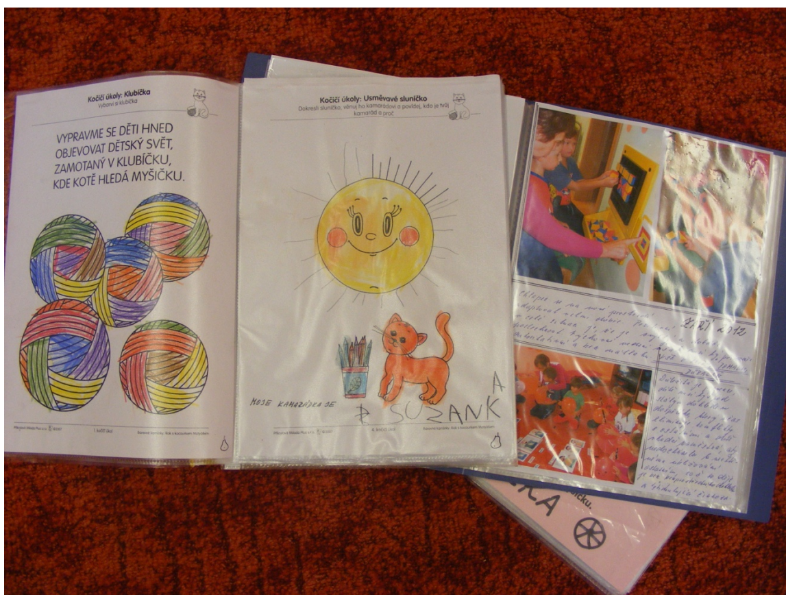
Portfolia jednotlivých dětí vypovídají o jejich práci a úrovni v průběhu rok.