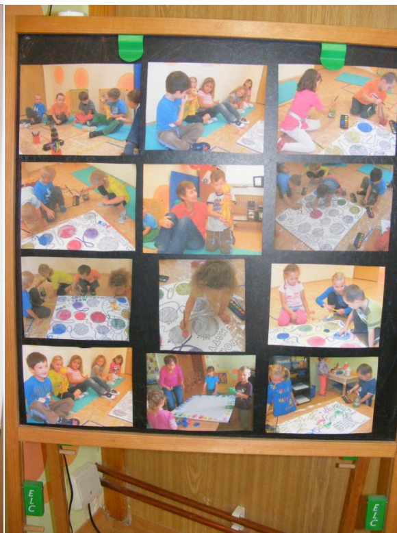
Když rodiče procházejí prostorem třídy a šatny, z pouhého pohledu „vyčtou“, co se ve školce děje. Fotografie a krátké články jsou více než dlouhé vysvětlování.